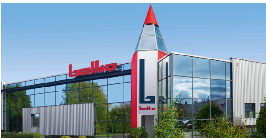
Modern und zukunftsorientiert: Balke-Firmensitz in Oststeinbek bei Hamburg.