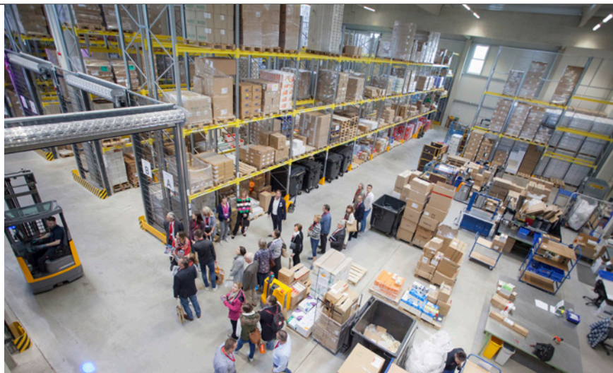
Für die neuen Herausforderungen gerüstet: das neue Logistikzentrum bietet viele Möglichkeiten.