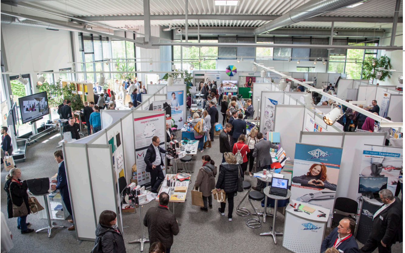
Viel Andrang, großes Interesse: die Balke-Hausmesse lockte mehr als 400 Gäste an den Firmenstandort.